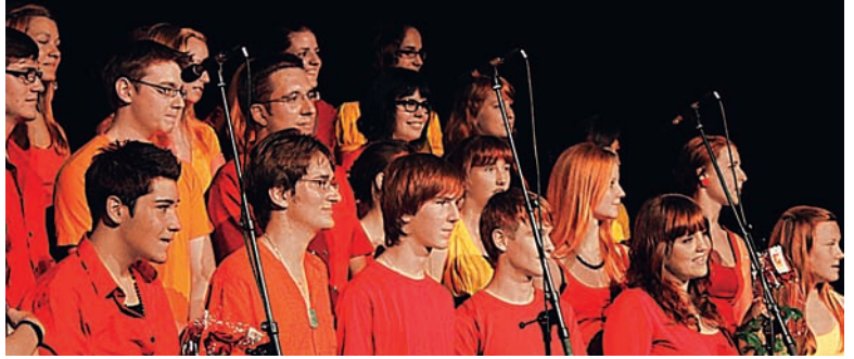
Der Jugendchor Sursee freut sich auf weitere Sängerinnen und Sänger.

Der Jugendchor probt jeweils am Montagabend von 19 bis 21 Uhr in der Klosterkirche in Sursee. Die Teilnahme im Jugendchor ist unentgeltlich. Es ist möglich, eine Schnupperprobe zu besuchen. Beigetretene Mitglieder verpflichten sich jeweils für ein Jahr. Der Jugendchor freut sich auf weitere Sängerinnen und Sänger. Im Jugendchor werden immer verschiedene Musikstile gepflegt. In diesem Jahr stehen Folk-, Pop-, Jazz- und Rocksongs im Vordergrund, welche unter anderem im Sommer am Open-Air am Altstadtfest in Sursee zur Aufführung gelangen. Als Höhepunkt singt der Jugendchor an die-