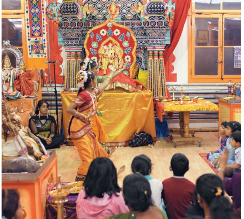
Hinduistischer Tempeltanz bei einer interreligiösen Feier.

Wie aktuelle Debatten zeigen, muss der Dialog nicht nur zwischen den Religionen stattfinden, sondern auch mit reli-