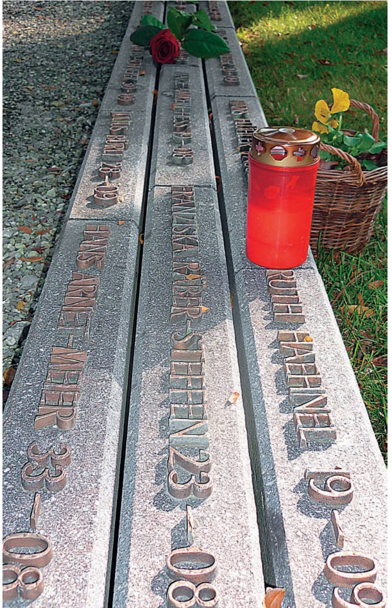
Gemeinschaftsgrab auf dem Friedhof Dägerstein in Sursee.